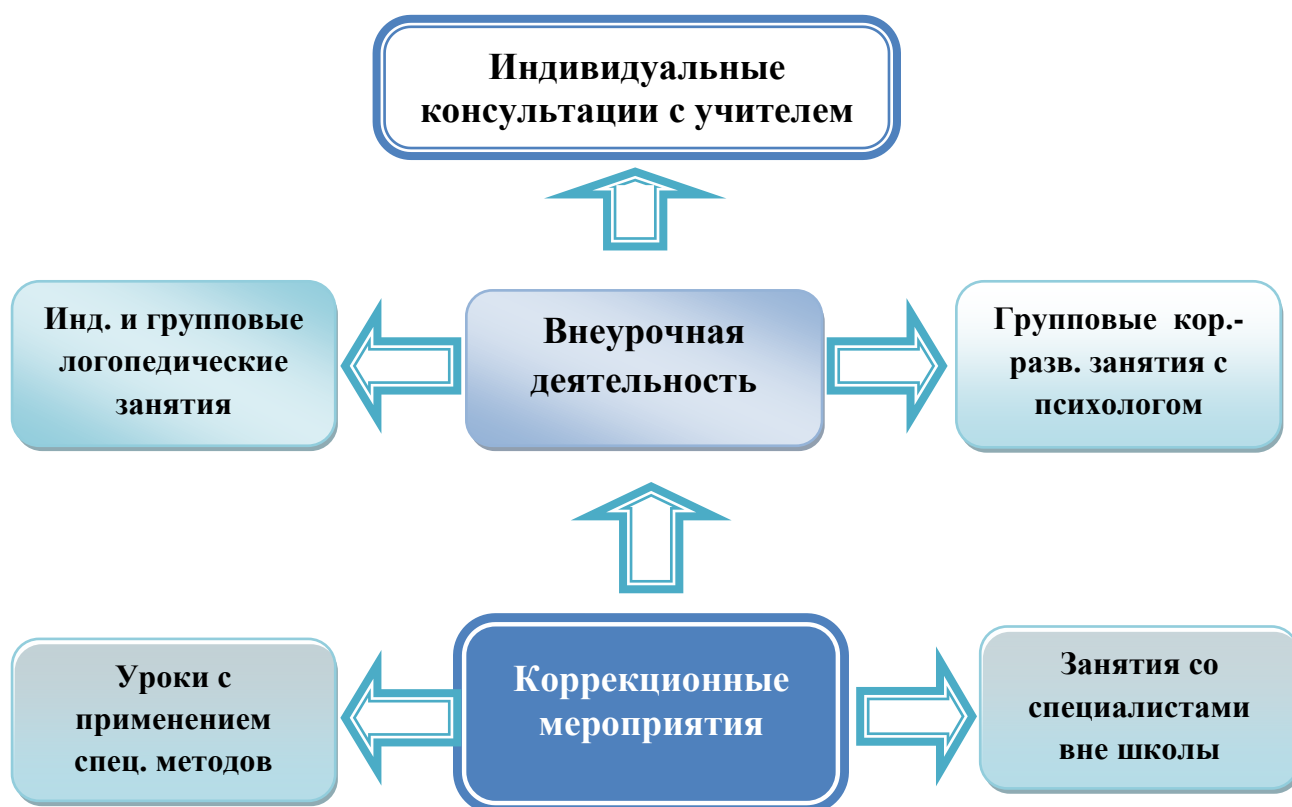
Схема «Реализация коррекционных мероприятий через различные формы работы»

Механизм взаимодействия в ходе осуществления коррекционной работы осуществляется посредством единства урочной, внеурочной и внешкольной деятельности, через формы работы учителя, специалистов, представленные на схеме.